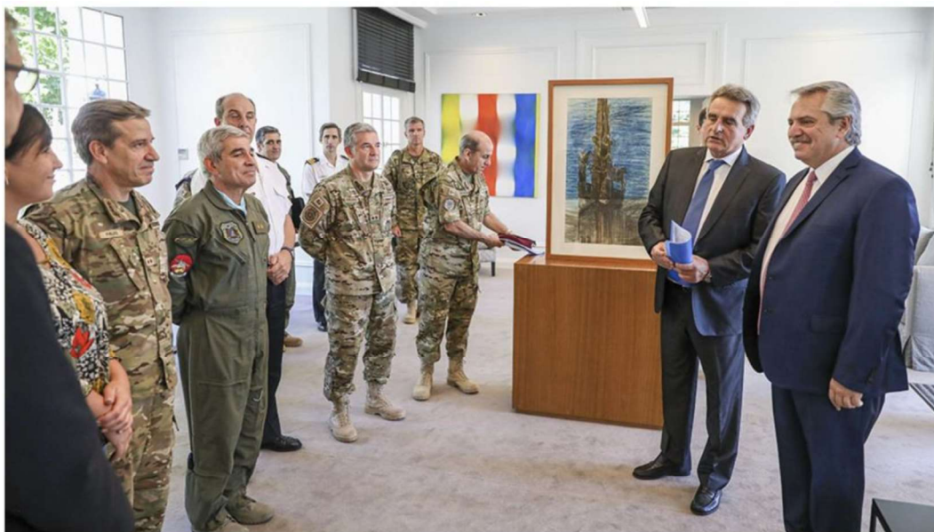
El Presidente, en sus oficinas de la Residencia de Olivos, rodeado de los Jefes de las FFAA

Así fue como el Gobierno Nacional dictó -entre el 12 y el 20 de marzo - una serie de “Decretos de Necesidad y Urgencia” (DNU) 12 , que es un instrumento amparado por la Constitución en su artículo 99, para ordenar todas las tareas que actualmente desarrollan las FFAA. Varias voces se alzaron en contra de estos DNU por considerarlos inconstitucionales ya que avasallaban derechos y garantías que solo podrían ser removidos mediante la declaración del estado de sitio 13 . Cualquier observador, sin necesidad de profundos análisis, puede concluir que el DNU (en especial el 297/20) 14 es prácticamente equivalente a declarar el estado de sitio, pero sin nombrarlo. Sí se encargaron de destacar y resaltar que las FFAA que se empeñaban en tareas humanitarias lo hacían sin portar armamento individual y con una custodia y seguridad inmediata proporcionada por la Gendarmería Nacional o la Policía Federal o provincial correspondiente.