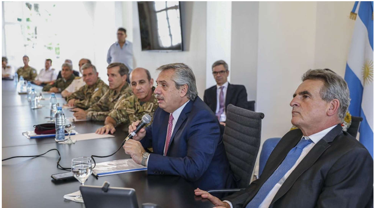
El Presidente y el Ministro de Defensa con los Jefes de las FFAA al decretar el aislamiento social o “cuarentena”

Imagino que ya mismo el lector estará aventurando conclusiones, imaginando situaciones, repasando ejemplos, declaraciones recientes, recordando acciones políticas u operaciones militares presentes, comparando su país de origen con otro, etc, y arriesgando una respuesta o un pronóstico a este interrogante.