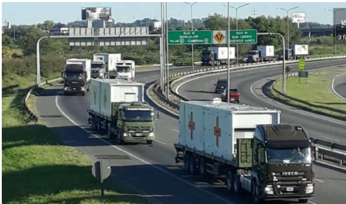
Camiones del Ejército trasladan material de sanidad en uno de los accesos a la Ciudad de Buenos Aires

No pocos funcionarios descubrieron que las FFAA ya habían empezado a aplicar protocolos de sanidad y de seguridad desde mucho antes de que el coronavirus fuese noticia, y que las primeras órdenes de protección databan de principios de febrero (40 días antes que para la mayoría de la población) cuando, ante los informes que llegaban desde China, se hizo imperioso tomar medidas sanitarias estrictas en las bases de la Antártida, lugar donde sería peligrosísimo que el coronavirus apareciese. Y con ello, se puso en marcha la rueda de órdenes y procedimientos de limpieza, desinfección, sanidad y seguridad para muchas instalaciones militares. Cuando esto mismo se implementó a nivel nacional, los militares tenían varias semanas de práctica al respecto.